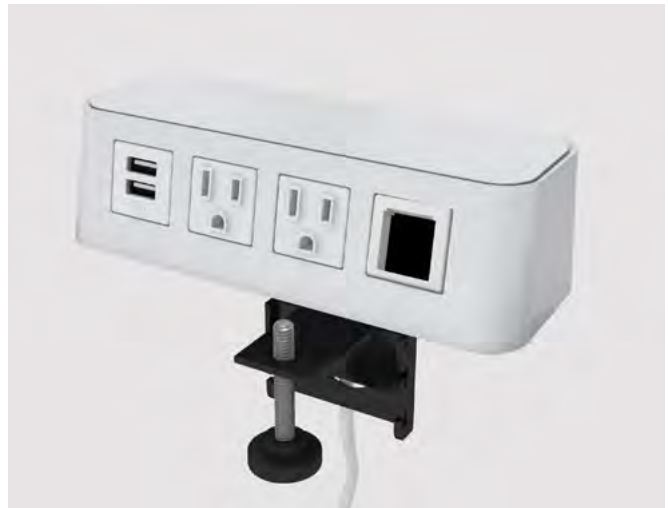
*Imagen: Burelé al borde de 4 puertos: 2 eléctricos, 1 USB de carga y 1 puerto abierto en color blanco.