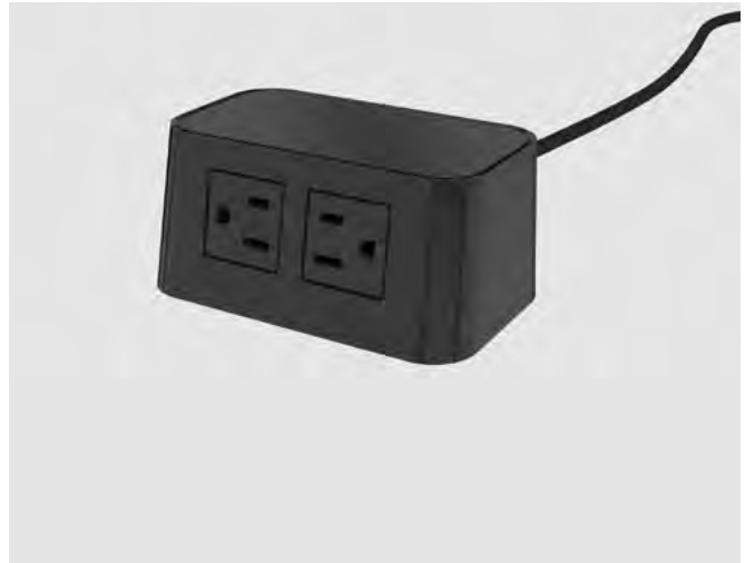
*Imagen: Burelé móvil de 2 puertos: 2 eléctricos en negro